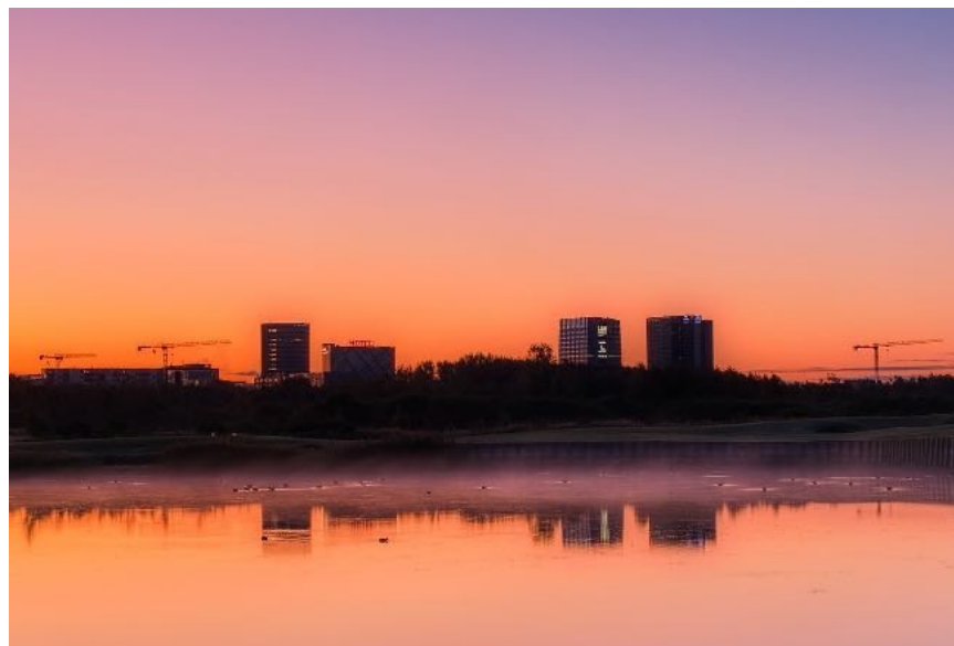
Entreprenørvirksomheden NCC henter sand, grus og ral fra bunden af Køge Bugt til brug i de store anlægsarbejder i Københavnsområdet.

For god ordens skyld skal det oplyses, at der i 2020 blev gennemført revision uden anmærkninger af regnskabet for 2019. Både dét og 2020-regnskabet vil blive forelagt den førstkommande generalforsamling.