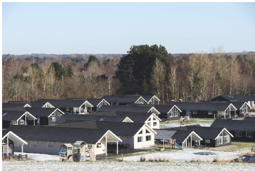
Megasommerhuse på Falster er blevet en sag for Planklagenævnet. Disse ligger dog i Vejby i Nordsjælland.

Andre bidrag eller ideer til kortlægningen modtages også gerne.