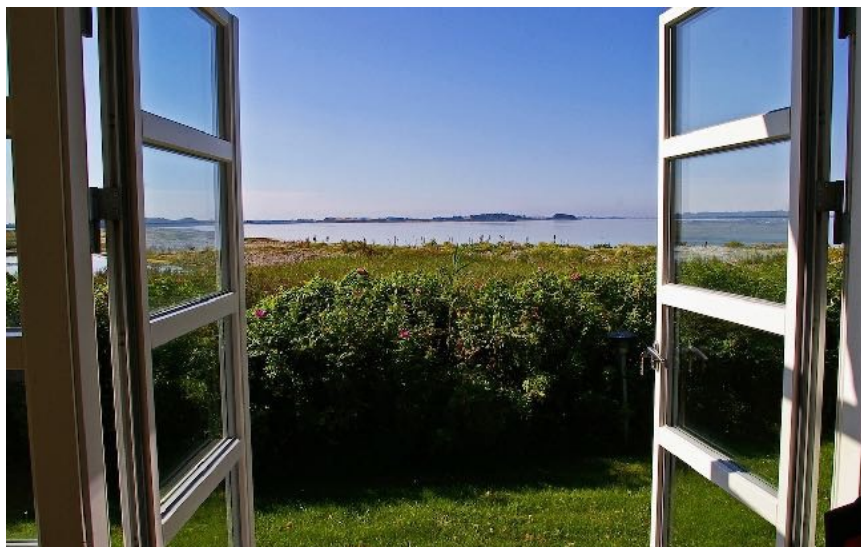
Tre ud af fem danskere regner med at holde sommerferien 2021 inden for landets grænser.